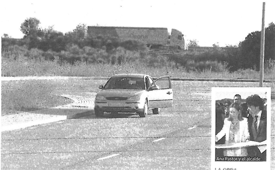
El polígono industrial, con un camión pasando, al fondo, por la autovía, aún sin acceso.

«No es que tengamos un retraso como tal, lo que ha pasado es que hemos tenido que resolver varias cuestiones, como fue la resolución de la única alegación que se presentó, que ha quedado denegada», comentó el regidor. «También durante este tiempo quedó resuelto el tema de la vía pecuaria, ya que en el informe de Medio Ambiente de la Junta de Castilla y León se solicitaba un cambio de señalización, puesto que cerca de las obras donde