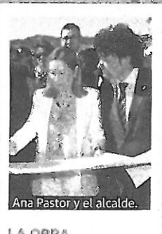
Ana Pastor y el alcalde.